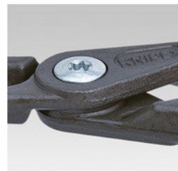
Шарнир свързан с болт: висока прецизност и оптимална подвижност