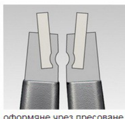
оформяне чрез пресоване