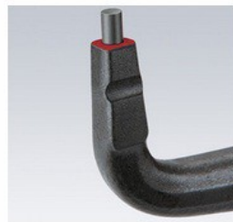
Стабилни, поставени върхове от високо уплътнена пружинна стомана