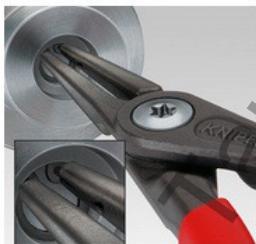
Тънка форма на главата

За върховете се използва висококачествена стомана с гладка повърхност. Вследствие на това върхът е устойчив на динамично и статично натоварване. Върховете при еднократно натоварване са с 30 % по-стабилни в сравнение с традиционните клещи, при същевременно добра достъпност при монтажа. При динамично натоварване върхът издържа до 10 пъти по-дълго! При прецизните зегер клещи върховете се закрепват чрез студена обработка. Върховете са неотделими!